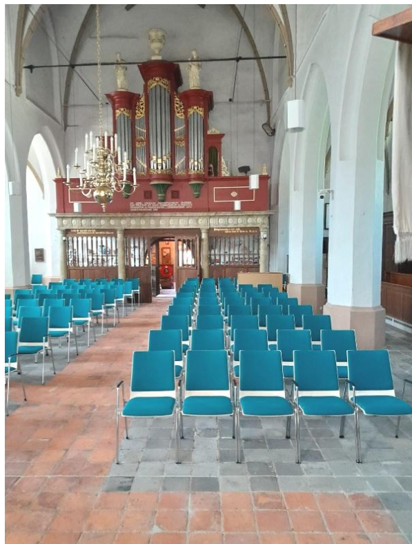
Impressie nieuwe stoelen

zo 26 juni: 15.00 uur: Kliederkerk, Ontmoetingskerk, Dieren zo 26 juni: 15.30 uur: Concert Utrechts Vocaal Ensemble, Dorpskerk ma 27 juni: 13.30 uur: Redactie Ontmoeting JBC wo 29 juni: 15.00 uur: Lezing Groene Theologie, Grote Kerk, Velp do 30 juni: 19.30 uur: Viering en herdenking afschaffing slavernij Keti Koti, Dorpskerk